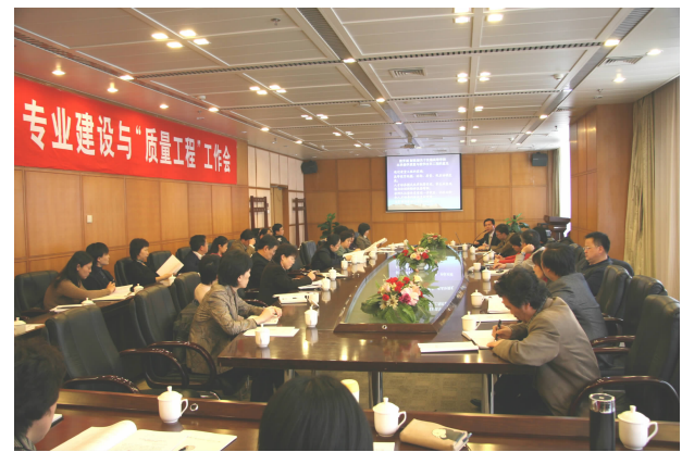
专业建设与“质量工程”工作

早在2007年底, 我校申报的对外汉语专业率先被教育部确立为第一类特色专业建设点。我校是全国最早开始招收对外汉语专业本科生的四所高校之一, 是全国招收对外汉语专业学生时间最长, 规模最大的学校。