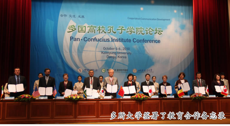
多所大学签署了教育合作备忘录

本报讯 为促进汉语国际教育事业的发展,为孔子学院提供经验交流与学习的平台以及资源共享的平台,并就孔子学院内涵建设和可持续发展问题进行深层次探讨,10月4日至6日,由北京语言大学和韩国启明大学联合主办的2010年“合作·交流·发展——多国高校孔子学院论坛”在韩国大邱启明大学成功举行。来自巴基斯坦、法国、古巴、韩国、加拿大、罗马尼亚、美国、日本、新加坡、意大利10国共25所大学及其孔子学院100多位代表齐聚一堂,分享孔子学院建设上取得的新成绩和新经验,探讨孔子学院在发展建设上的新理念、新思路。 我国驻釜山总领事关华兵、驻韩大使馆教育参赞艾宏歌出席论坛开幕式并致辞,国家汉办专员徐强宣读了国务院参事、国家汉办主任、孔子学院总部总干事许琳致本论坛的贺信,韩国大邱广域市教育厅长禹东琪、大邱广域市副市长南东均出席并致辞。韩国启明大学校长申一熙向全体嘉宾致欢迎辞。 与会者围绕“跨区域合作的孔子学院发展新格局”的主题,就孔子学院教学资源与合作研发教材、多国孔子学院教师培训及本土化教师培养以及孔子学院如何和社区合作的问题进行了探讨,交流分享工作成绩和经验。 北京语言大学校务委员会主任王路江作了题为“求同与存异——全球化背景下孔子学院的合作与发展”的主题报告,她说,目前“教材”、“教师”和“教法”是制约汉语国际教育发展的三个瓶颈。在这种情况下,世界各国的孔子学院应该本着“求同存异”的原则,在相对统一的汉语教育标准和课程设置标准下,因地制宜,因材施教,办出自己的特色和风格,走出一条创新发展的道路。 启明大学校长申一熙教授在主题报告中说,他十分欣赏孔子“仁”的思想,笃信“己欲利人,己欲达人”的原则,相