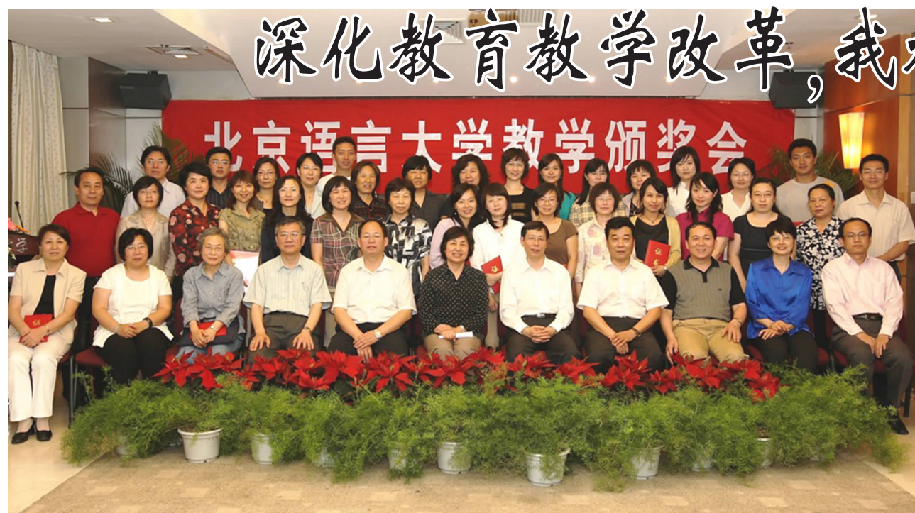
北京语言大学教学颁奖会

在2008年2月16日举行的学校中层干部会议上, 学校党委要求全校上下高度重视教学质量与教学改革工程工作, 并将2008年确定为“质量年”, 为大力开展“质量工程”工作营造良好氛围。