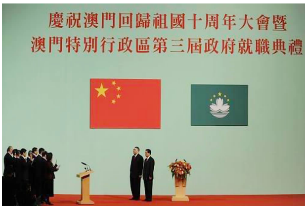
澳门回归 10 周年