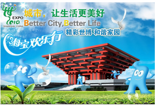
上海世博会倒计时