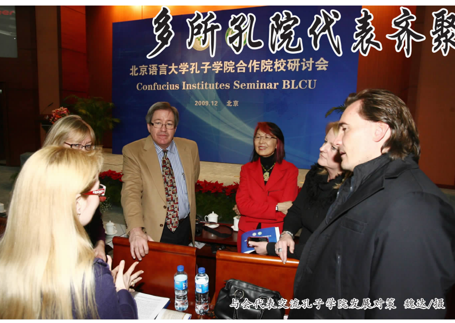
多所孔院代表齐聚北语 交流孔子学院办学经验

党委副书记兼纪委书记赵曼对我校近年来的党风廉政建设和反腐败工作进行了回顾和总结,并从八个方面对我校2010年反腐倡廉建设的主要任务作了具体安排和部署。一是要严守党的政治纪律,确保中央重大决策部署落实;二是要加强领导干部作风建设,进一步树立和弘扬良好风气;三是要全面落实党风廉政建设责任制,完善责任体系;四是要加强对重点部位、关键环节的监督;五是要加强教育监督和制度创新,加快推进惩治和预防腐败体系建设;六是要积极推进廉政风险防范机制建设;七是要进一步规范教育收费,抓好纠风工作;八是要认真处理来信来访,加大查办、惩治违纪案件力度。(纪委办公室 张金明)