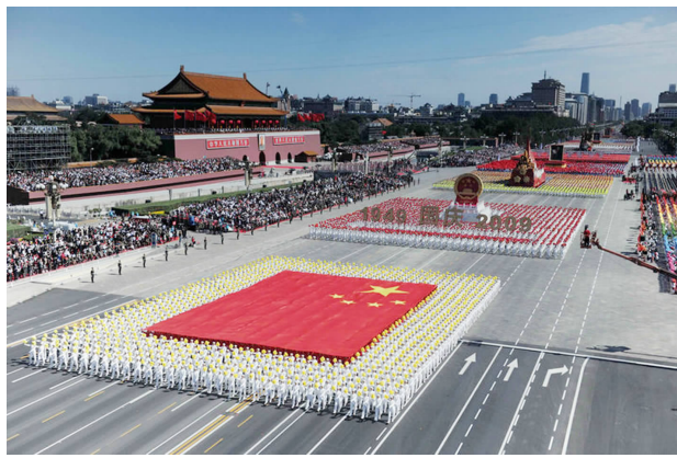
新中国成立 60 周年