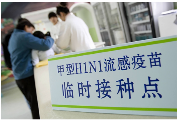
甲型 H1N1 流感