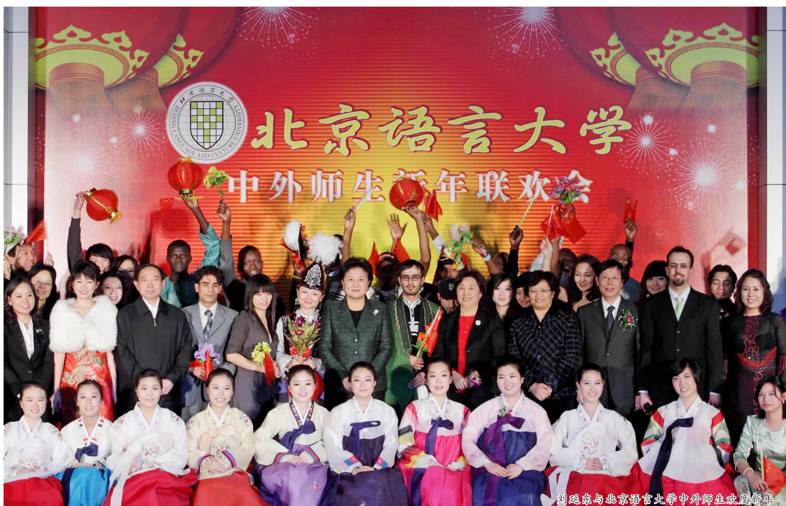
刘延东与北京语言大学中外师生欢度新年

本报讯 12月31日,在2010年元旦即将来临之际,中共中央政治局委员、国务委员刘延东来到北京语言大学,看望了在校的中外师生,与来自美国、英国、意大利、韩国、日本、保加利亚、喀麦隆、加纳等50多个国家留学生一起迎接新年的到来,并代表党中央国务院、中国政府向所有来华留学生和广大师生员工致以新年的祝福。教育部部长袁贵仁,教育部副部长李卫红,国务院研究室副主任江小涓,国家汉办主任许琳等陪同莅临北京语言大学。