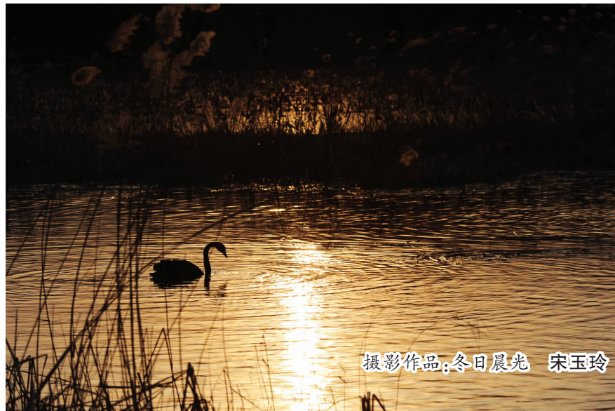
摄影作品：冬日晨光 宋玉玲

有这样一个地方，让我夜夜梦回。一丛开得太盛的野花，一只呱呱叫着的喜雀，一个古朴青瓷的老井，一缕舞动的炊烟……这一切组合成这样一个地方，我的故乡。