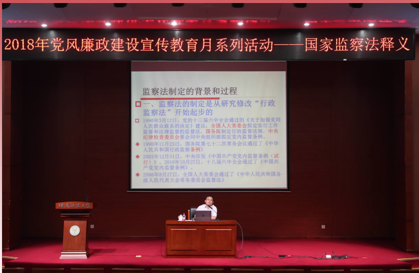
2018年党风廉政建设宣传教育月系列活动——国家监察法释义

国家监察法释义 监察法制定的背景和过程 一、监察法的制定是从研究修改“行政监察法”开始起步的 1994年12月25日，九届全国人大常委会通过的《关于加强和改进监察工作的决定》提出，全国人大常委会制定行政监察法，国务院制定行政监察条例，中央和地方各级监察委员会和各级监察机关制定监察法规。 1997年11月25日，国务院第七十二次常务会议通过了《中华人民共和国行政监察法》。 2003年12月31日，中央印发《中国共产党党内监督条例（试行）》，增加“行政监察”一章，十九届六中全会通过了《中国共产党党内监督条例》。 2018年3月20日，十三届全国人大一次会议通过了《中华人民共和国监察法》。