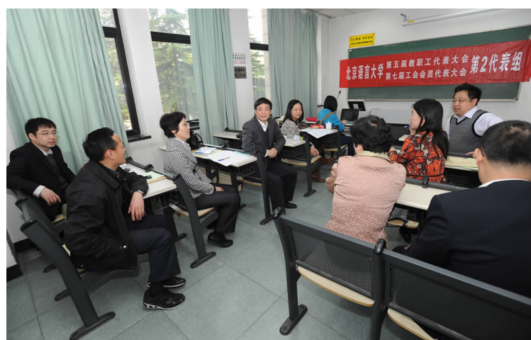
北京语言大学第五届教代会第二次会议第二次全体会议

我认为,汉语国际教育由留学生的本科教育、留学生的进修教育和留学生的预科教育三大部分组成。三部分都应获得足够重视,使之共同发展,协调发展。而“对留学生进行汉语教育”是其共同的教学内容之一,我们应