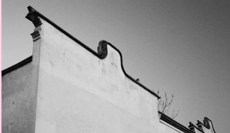
作者单位:信息科学学院