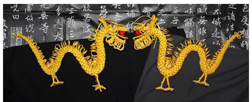
“宝相团花”寓意吉祥美满;“莲香”寓意君子出淤泥而不染;“双龙”寓意吉祥。(制作:供图,发展规划处 邵扬)