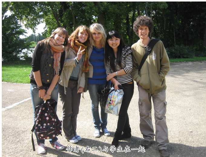
作者(右三)与学生在一起

这些美好的感动，成为我生命的一部分。其实学生和教师，可能在一起的时间相当短暂，也许我以后也会淡忘在他们的记忆里，但是对我来说每一批学生都是独一无二的，都应当用心用爱去教，不要留有遗憾。正所谓“一期一会，且行且珍惜”。