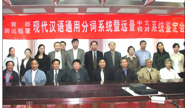
现代汉语通用分词系统获得教育部提名国家科技进步二等奖