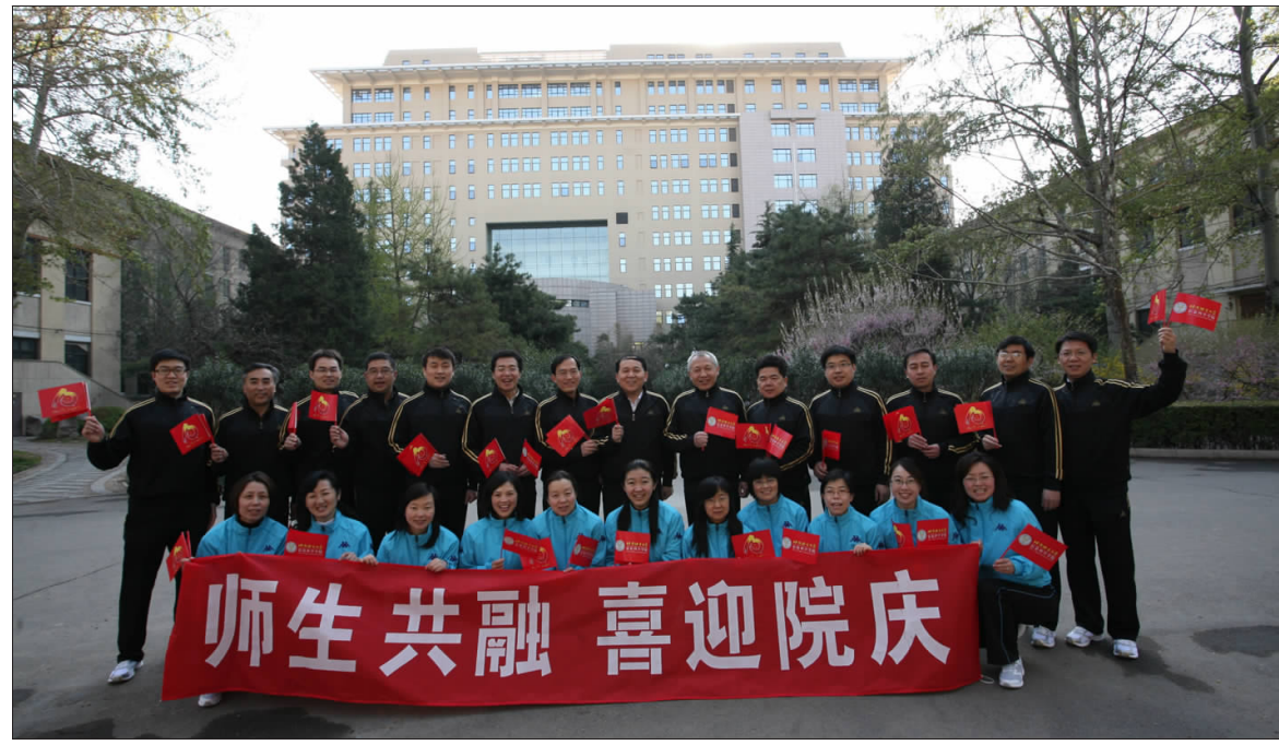
师生共融 喜迎院庆

十年风雨同心共渡,十年精神薪火传承。以2000年计算机科学与技术系成立为起点,我校信息科学学院已经走过了十年的风雨历程。