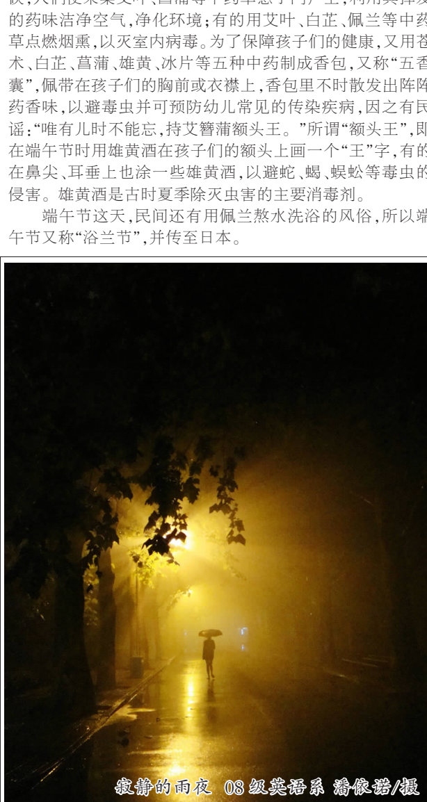
寂静的雨夜 08级英语系 潘依诺/摄

怀念屈子忠魂祭,龙舟竞渡庆端阳。麦浪滚滚传布谷,神州处处飘粽香。农家户户插艾蒲,村童个个佩香囊。防毒灭虫为健康,浴兰额头沐雄黄。 中国农历五月初五为民间传统的端午节,又名端(端为“初”的意思)五节,端阳节,重五节。 关于端午节的历史说法不一,以纪念春秋战国时代的爱国诗人屈原为主流,屈原因为自己的祖国——楚国灭亡而投汨罗江殉节。端午节这天,民间有赛龙舟、吃粽子的习俗,传说这与屈原有关。南朝梁人宗懔所著的《荆楚岁时记》一书载:“屈原以是日死于汨罗江,人伤其死,并将舟楫以拯之,今竞渡是其迹。”同时代的吴均在《续齐谐记》中也载:“屈原五月五日投汨罗江,楚人哀之,至此日以竹筒贮米,投水祭之。”后来演变为以糯米包成粽子投江水中,并吃粽子以纪念屈原。 端午节这天,汉民族除了吃粽子、赛龙舟以外,还有在门口前插艾叶,挂菖蒲,人佩香包,并用雄黄酒灭五毒等习俗。《荆楚岁时记》中还载,南北朝以前就有端午插艾的风俗:“五月初五,……采艾以为人形,悬门户上,以禳毒气。”由于端午节恰在“小满”和“夏至”节气之间,正是传染病开始发生的时候,人们便采集艾叶、菖蒲等中草药悬于门户上,利用其挥发的药味洁净空气,净化环境;有的用艾叶、白芷、佩兰等中草药点燃熏,以灭室内病毒。为了保障孩子们的健康,又用苍术、白芷、菖蒲、雄黄、冰片等五种中药制成香包,又称“五香囊”,佩带在孩子们的胸前或衣襟上,香包里不时散发出阵阵药香味,以避毒虫并可预防幼儿常见的传染疾病,因之有民谣:“唯有时儿不能忘,持艾簪蒲额头王。”所谓“额头王”,即在端午节时用雄黄酒在孩子们的额头上画一个“王”字,有的在鼻尖、耳垂上也涂一些雄黄酒,以避蛇、蝎、蜈蚣等毒虫的侵害。雄黄酒是古时夏季除灭虫害的主要消毒剂。 端午节这天,民间还有用佩兰熬水洗浴的风俗,所以端午节又称“浴兰节”,并传至日本。