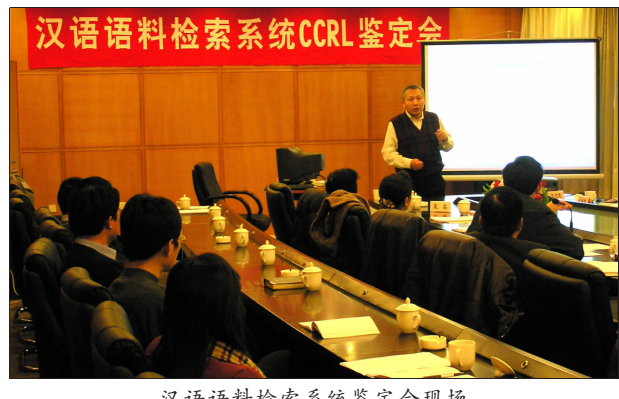
汉语语料检索系统CCRL鉴定会现场