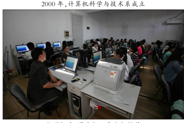
教机房,学生们正在上机操作

2000年,计算机科学与技术系成立。在随后的十年里,信科学子在各级各类竞赛中屡获佳绩,共获得国家级竞赛奖励200余项。